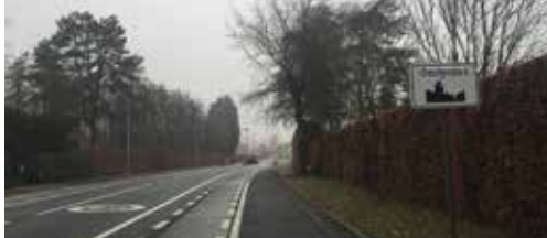
Bestuur investeert in ... Oostende p. 2