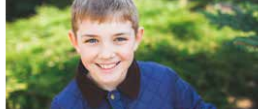
Jeugd verdient beter p. 3