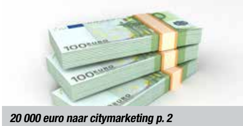
20 000 euro naar citymarketing p. 2