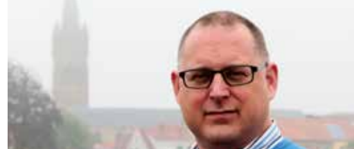
Kerktoeren Hooglede eindelijk geopend p. 3